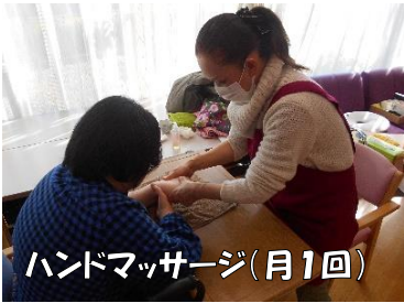
ハンドマッサージ(月1回)