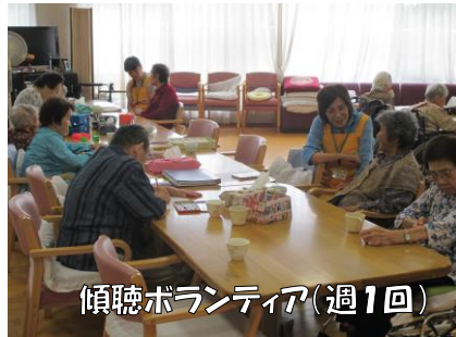
傾聴ボランティア(週1回)