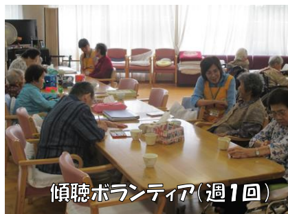
傾聴ボランティア(週1回)