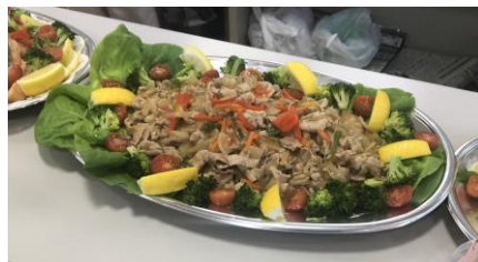
ランチバイキング