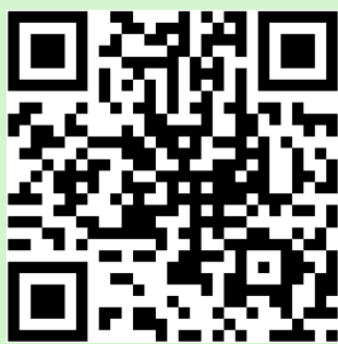
体験メニュー一覧

当日は体調を整え、元気にボランティア活動を行きましょう！ ※社会福祉協議会でボランティア活動保険に加入します。 令和9年3月31日まで有効です。